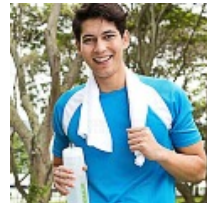
ฟิตซ้อมและเสริมโภชนาการ เคล็ดลับนักวิ่งก่อนลงสนาม