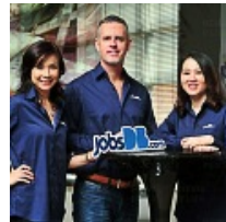
jobsDB เผย 4 แนวโน้มที่มีผลต่อการจ้างงาน ที่มาแรงที่สุดในปัจจุบัน