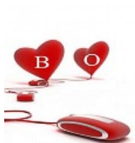
กรุ๊ปเลือดกับการรับมือกับความเจ็บปวด