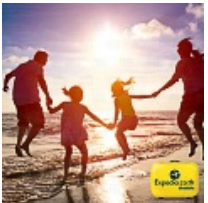
เอ็กซ์พีเดีย ชี้คนไทยเชื้อจะมีสุขเพิ่มขึ้นหากได้วันลาพักผ่อนเพิ่ม